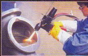
閥座實施陶瓷噴塗